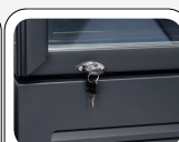
Κλειδαριά στον βασικό εξοπλισμό