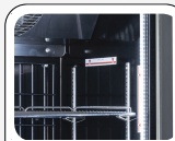
Εσωτερικός φωτισμός LED