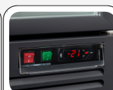
Κεντρικός διακόπτης, διακόπτης φωτισμού και ηλεκτρονικός θερμοστάτης στον βασικό εξοπλισμό